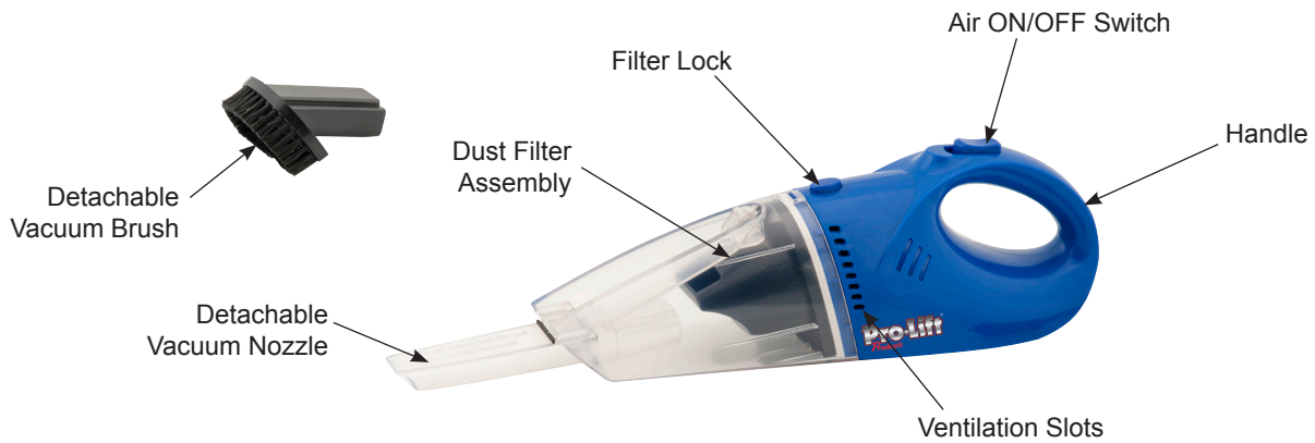
Figure 1 - I-8860 Components