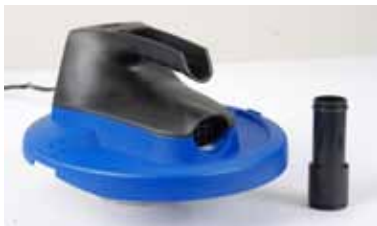
Couvercle de l'aspirateur et adaptateur de tuyau