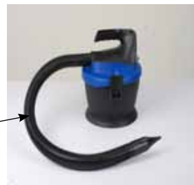
Tuyau branché sur la soufflerie