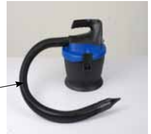
Hose attached to Blower Port